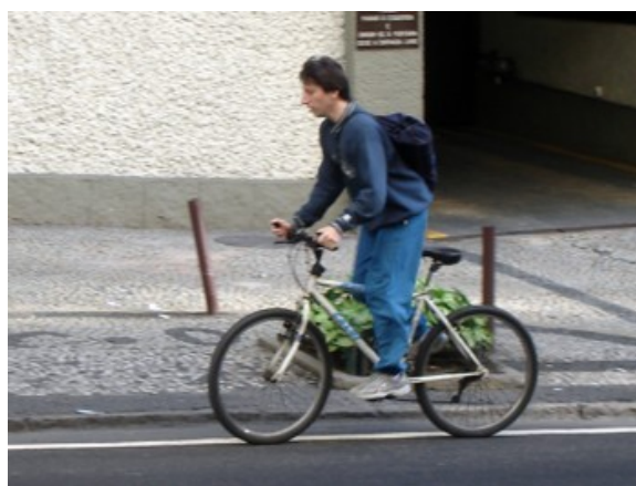
18 Rua Direção Lagoa bordo 2,3%