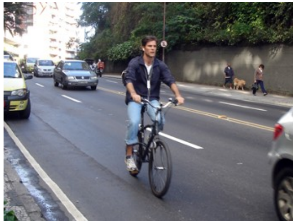
27 Rua Direção Copacabana ocupando a faixa 3,5%