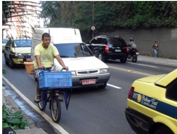
67 Rua Direção Copacabana bordo 8,6%