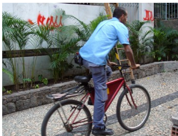
268 de serviço , 34,5% sendo: