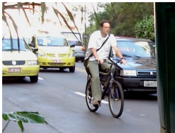
4ªh 72 ciclistas 10 às 11