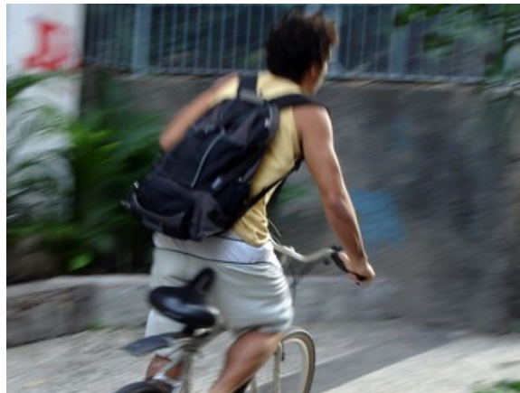
433 Calçada pista direção Copa 55,6% Independente da direção