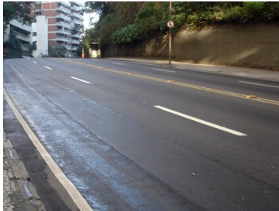
0 até 12 anos