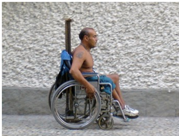
1 cadeira de rodas