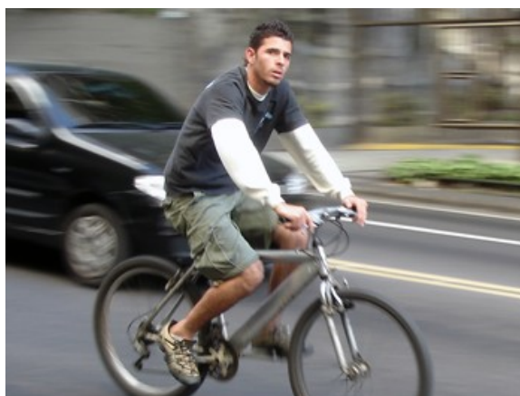
2ªh 44 ciclistas 8 às 9