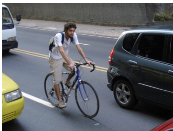
8ª h 56 ciclistas 14 às 15