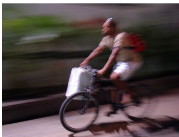
11ª h 55 ciclistas 17 às 18