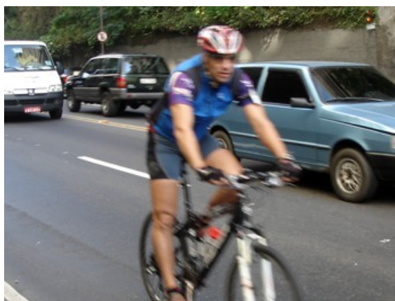
8 com roupa de ciclista.

Todas as fotos estão disponíveis em: http://www.ta.org.br/site/img/ctcc/ As fotos estão disponíveis também em alta definição: entre em contato para saber como obtê-las. contato@ta.org.br