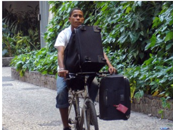
132 normais, 17% do total / 49% das de serviço