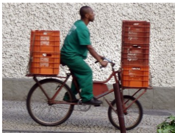
5ªh 69 ciclistas 11 às 12