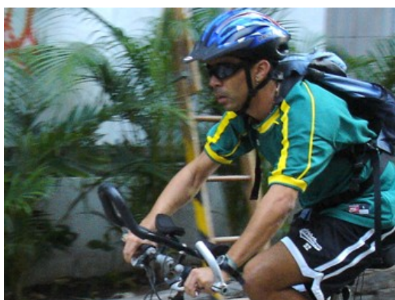
13 de capacete, 1,7%