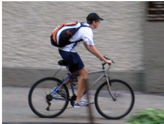
174 com mochila ou bolsão tiracolo , 22,4%