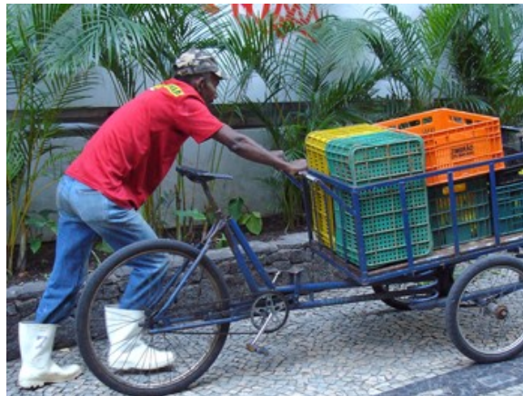
7ª h 78 ciclistas 13 às 14