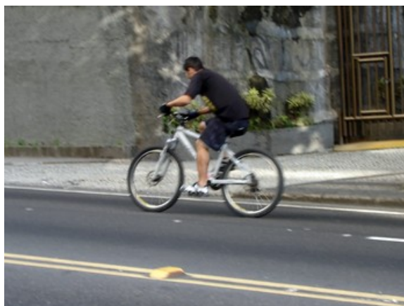
3 Rua Direção Lagoa ocupando a faixa 0,4%