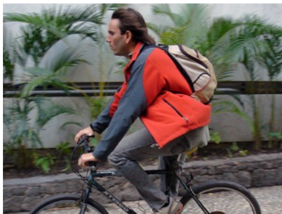
624 de 18 até 40 anos, 80%