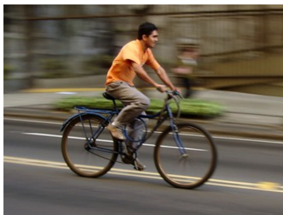
146 Total pela rua 18.7%