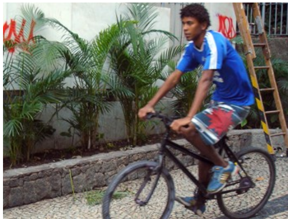
44 de 12 até 18 anos 5.7%