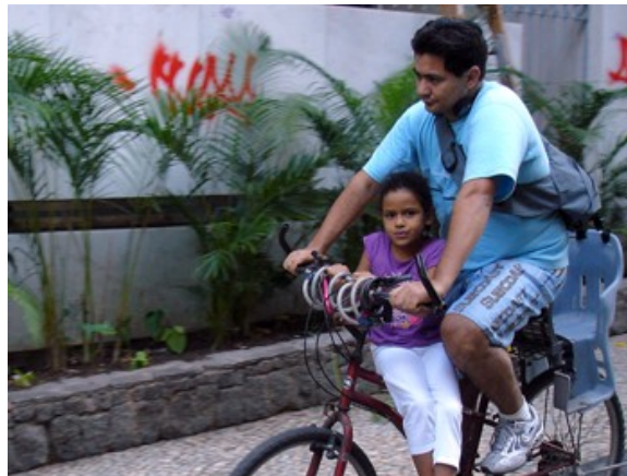
23 com criança de carona , 3%