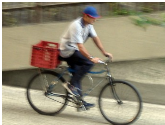
9ª h 69 ciclistas 15 às 16