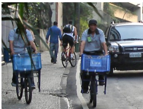
10ª h 62 ciclistas 16 às 17