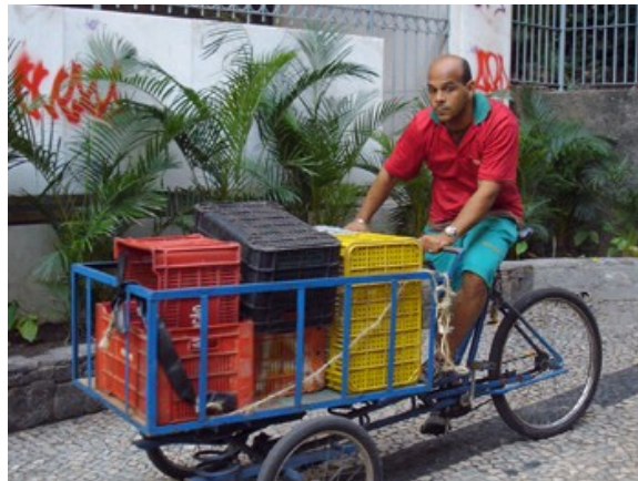
633 Total pela calçada 81.3%