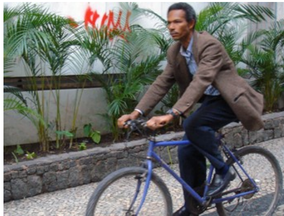
6ª h 83 ciclistas 12 às 13 Pico.