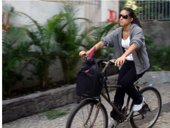
3ªh 79 ciclistas 9 às 10