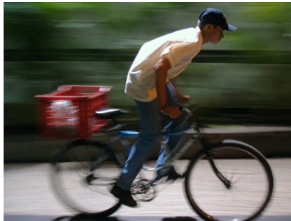
12ª h 68 ciclistas 18 às 19h