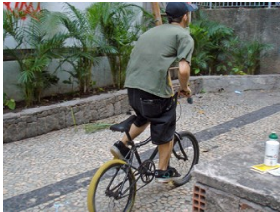
1 aro 20