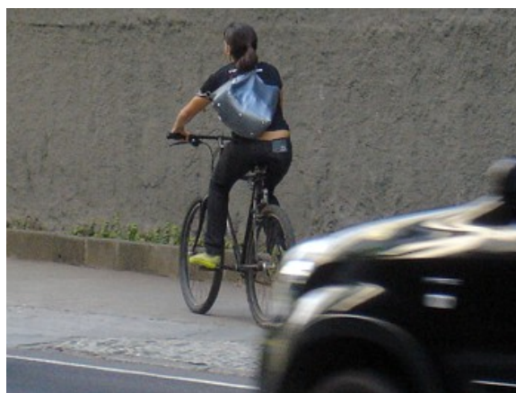
212 Calçada pista direção Lagoa 27,2% Independente da direção