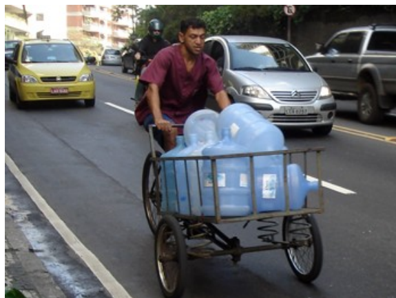
44 triciclos , 5,7% do total / 16.5% das de serviço