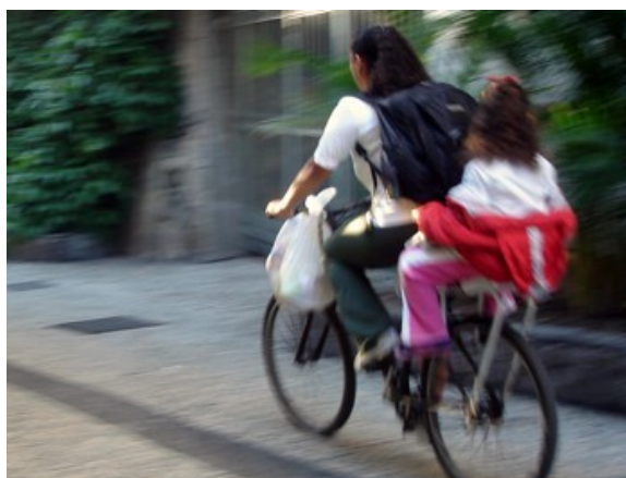
1ªh 44 ciclistas 7 às 8