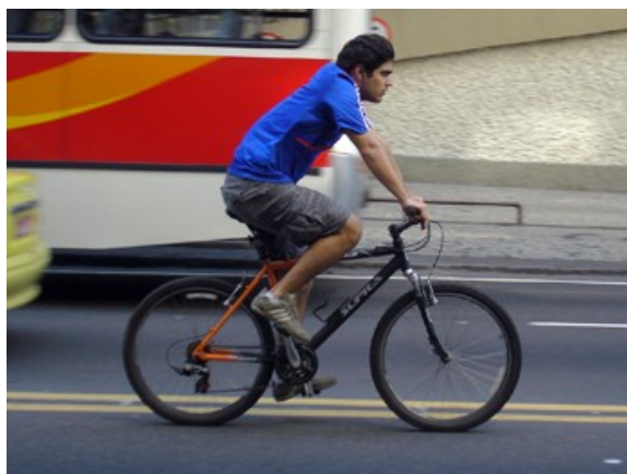
19 Pelo meio da rua, faixa central - Linha divisória 2,5%