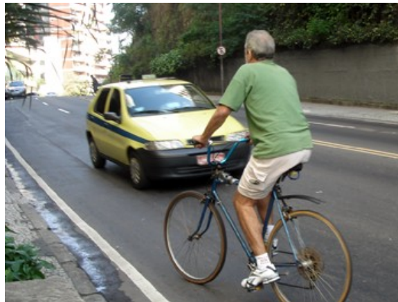
10 Pela rua na contra mão 1,3% (7% dos que iam pela rua)