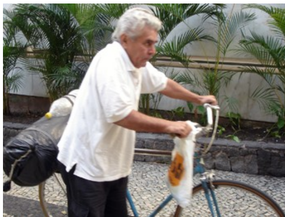
111 acima de 40 anos, 14.3%