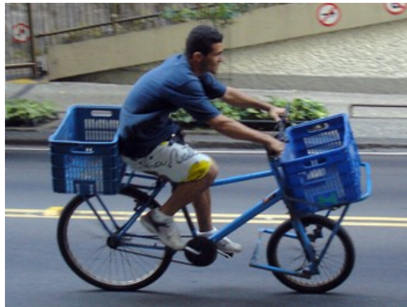
92 cargueiras, 11.8% do total / 34,5% das de serviço